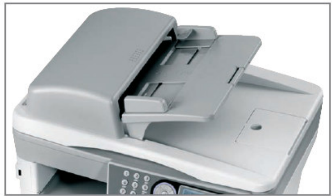
ALIMENTATORE AUTOMATICO DI ORIGINALI (ADF) di serie da 50 fogli

su normale carta da ufficio. Infine, è possibile gestire con semplicità la produzione di diverse tipologie di documenti, inclusi striscioni da 1,2 m di lunghezza (solo d-Color MF2000).