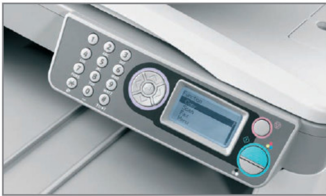
INTUITIVO PANNELLO OPERATORE per produrre copie e sfruttare la potenza della scansione in rete al PC